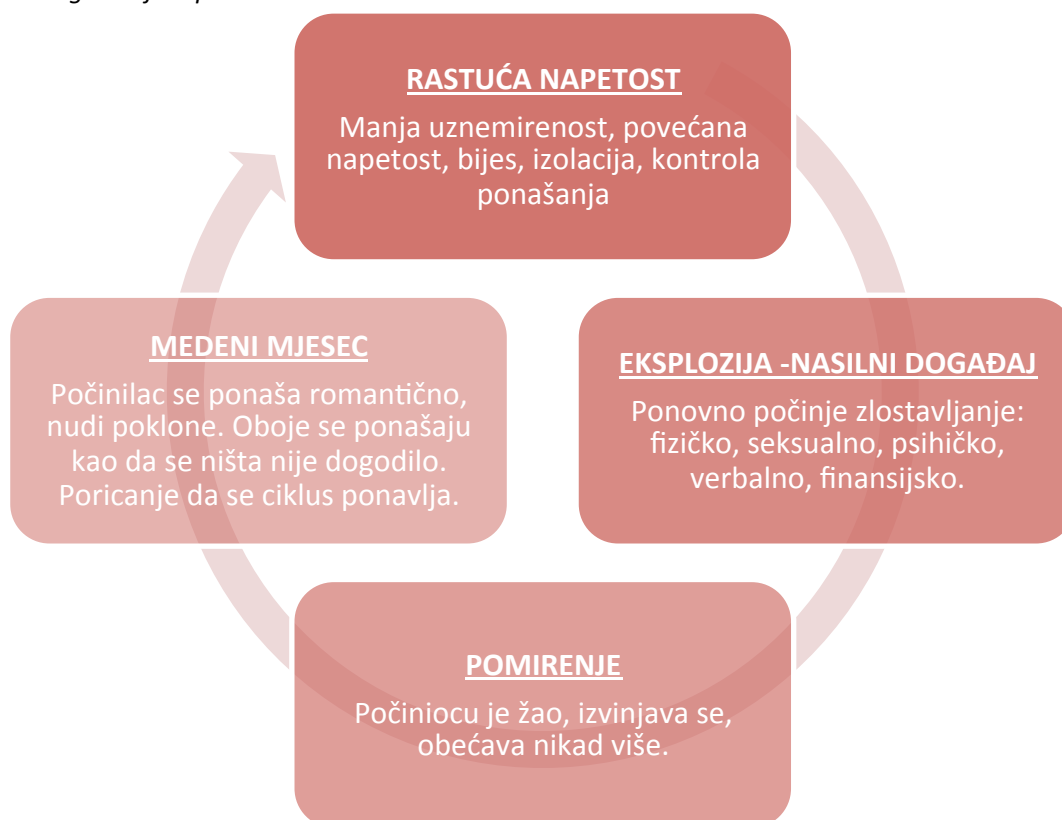
Slika 2: Krug nasilja u porodici

Intervencija krivičnog sistema, uz radnje policije na predlaganju izricanja zaštitnih mjera po osnovu Zakona o zaštiti od nasilja u porodici, predstavlja osnovni način da se prekine krug nasilja. Iz tog razloga u interesu žrtve je - kako bi žrtva dobila satisfakciju kroz krivični postupak - da tužiocu istraju u predmetima nasilja u porodici čak i kada žrtva ne saraduje ili traži odbacivanje optužbi i ulože maksimalan napor u prikupljanju svih dokaza. U dijagramu je objašnjeno i zašto se kajanje ili period dobrog ponašanja optuženog ne treba cijeniti kao olakšavajuća okolnost. To nikako nije pokazatelj da je krug nasilja prekinut.