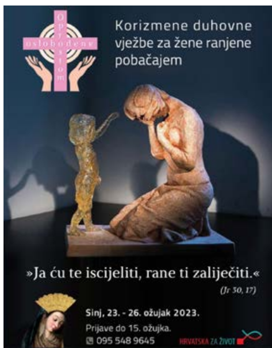
Slika 1. Promotivni plakat Hrvatske za život

U BiH, kao i u Hrvatskoj, abortus je legalan do deset sedmica trudnoće, ali nakon toga je potrebno odobrenje komisije. Ipak, dok se prekid trudnoće iz medicinskih razloga pokriva iz fondova obaveznog zdravstvenog osiguranja u BiH, abortus na zahtjev pacijentice (namjerni prekid trudnoće) ona mora platiti sama. 28 Institucija ombudsmena BiH također je utvrdila da usluge namjernog prekida nisu dostupne u svim dijelovima zemlje, uključujući Kanton 10 i neka područja Mostara, te da žene navode da dobijaju malo informacija ili savjeta o abortusu. 29