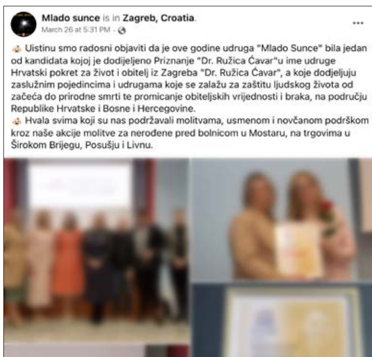
Slika 2. Fotografije koje je Mlado sunce objavilo na Facebooku

Pobačaj je zlo u sebi. Nikakve socijalne indikacije, nikakvi naučni razlozi ne mogu opravdati direktanog pobačaja, niti učiniti da on bude nešto drugo nego što uistinu jest, i što pred Bogom ostaje, naime ubojstvo nevinog čovjeka. A hotimično ubojstvo nevinog čovjeka vapi u nebo za osvetom. Ono je odurno i grešno uvijek, a osobito onda ako mu je izvor osobni interes i pohlepna težnja za stjecanjem.