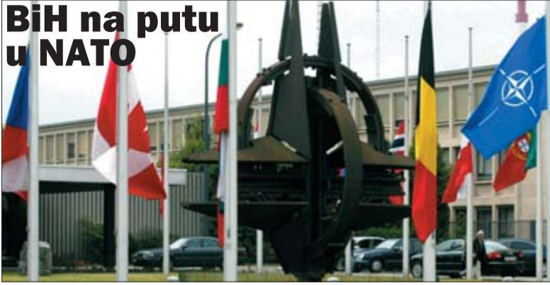
Sjedište NATO-a u Bruxellesu: Ne treba gubiti vrijeme