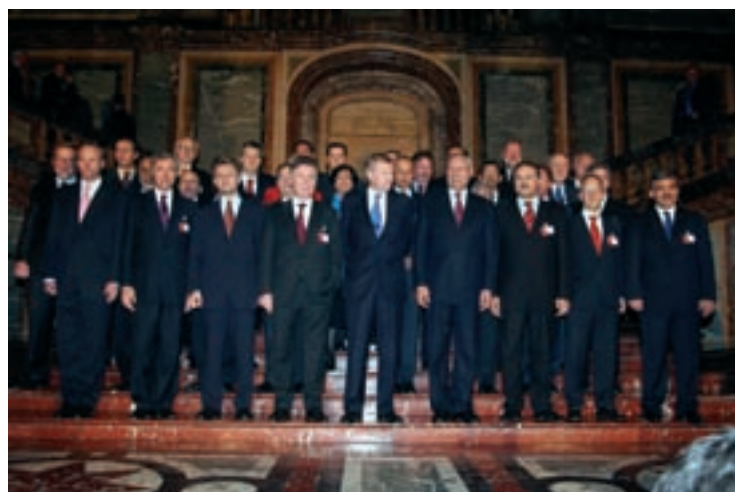
Prvi sastanak na ministarskom nivou sa zemljama-partnerima Mediteranskog dijaloga u Briselu, Belgija, 8. decembar 2004.g.

Od tada su političke diskusije postale češće i intenzivnije, a struktura razvijenija, pa su se mogućnosti za konkretniju saradnju unutar Mediteranskog dijaloga postepeno otvarale. Godišnji radni program, uspostavljen 1997.g. se stalno širio i obuhvatao veći broj elemenata i aktivnosti koji proizilaze iz Partnerstva za mir, uključujući vojnu saradnju, planiranje za slučaj civilnih vanrednih situacija, naučnu i ekološku saradnju.