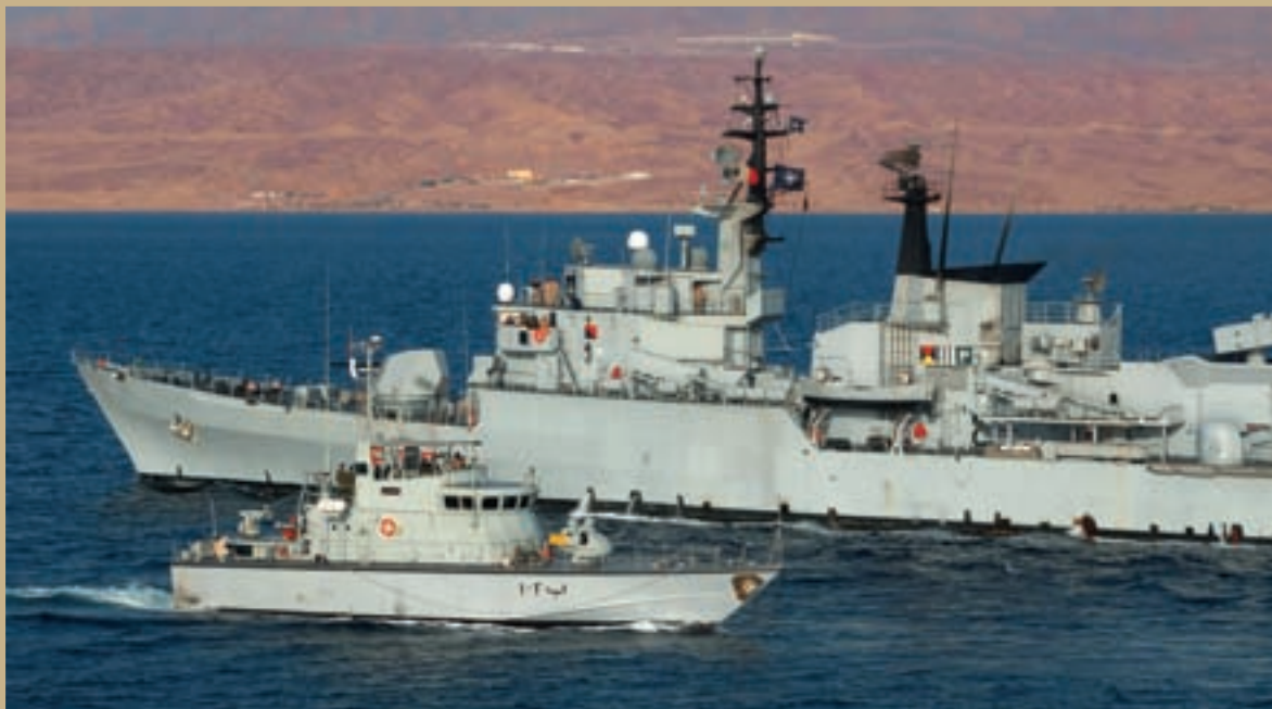
Patrolni čamac Jordanske mornarice prolazi pored NATO minolovaca tokom vježbe organizirane sa zemljama Mediteranskog dijaloga u zalivu Aqaba u martu 2005.g.

NATO razvija tješnje sigurnosno partnerstvo sa zemljama Mediterana i šireg Bliskog istoka, što je znak pomaka prioriteta Saveza ka većem angažmanu u ovim strateški važnim regionima svijeta, čija je sigurnost i stabilnost tijesno povezana sa sigurnošću euroatlantskog regiona. Sadašnja tendencija proširenja dijaloga i saradnje sa zemljama ovih regiona zasnovana je na dvije ključne odluke koje je NATO donio na samitu u junu 2004.g.